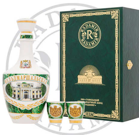
Водка «Фельмаршальская» сув. набор (книга, 2 рюмки), 1 л / Vodka «Fieldmarshalskaya» souvenir set (book, 2 glasses), 1 L