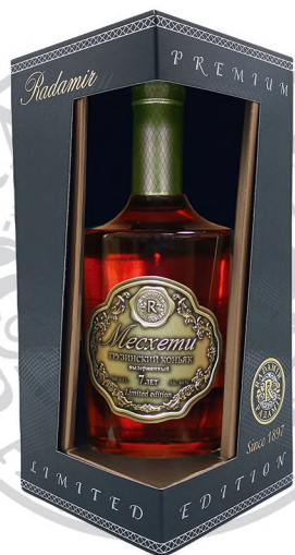
Коньяк «Месхети», 7 лет, 0,5 л / Cognac «Meskheti», 7 year old, 0.5 L