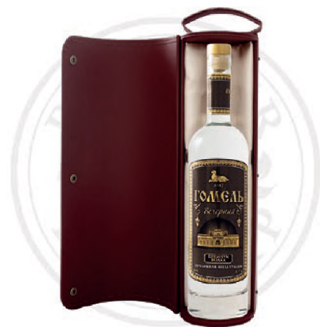
Водка «Вечерний Гомель» в бордовом сувенирном футляре, 0,7 л / Vodka «Evening Gomel» in burgundy souvenir case, 0.7 L