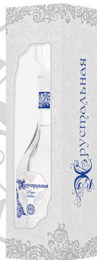
Водка «Хрустальная» в сувенирной упаковке, 0,5 л / Souvenir box «Khrustalnaya», 0.5 L