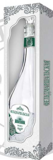
Водка «Фельдмаршальская» в сувенирной упаковке, 0,5 л / Souvenir box «Fieldmarshal», 0.5 L