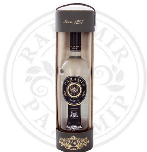
Водка «Радамир» в сувенирном футляре открытого типа, 0,7 л / Vodka «Radamir» in an open-type souvenir case, 0.7 L