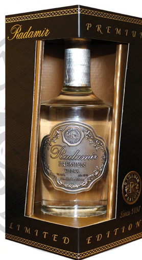
Водка «Радамир» в сувенирной упаковке, 0,5 л / Souvenir box «Radamir», 0.5 L